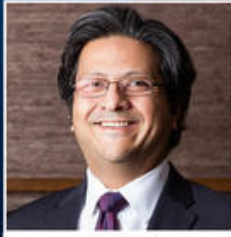
شاه زاده داود