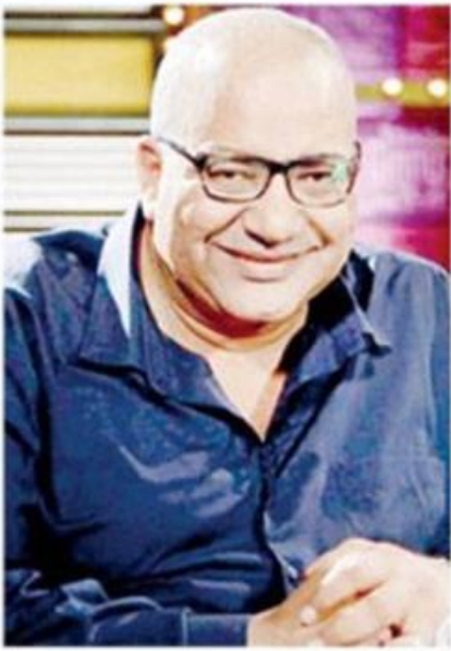
■ بيومي فؤاد ■